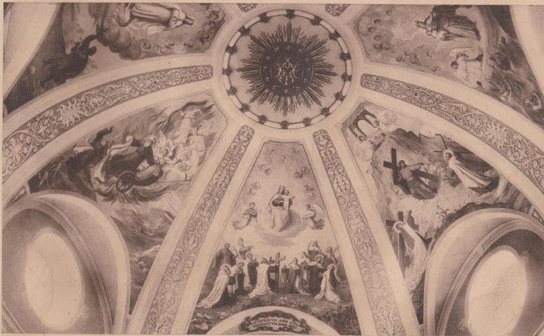
KÁRMELITA TEMPLOM FRESKÓI