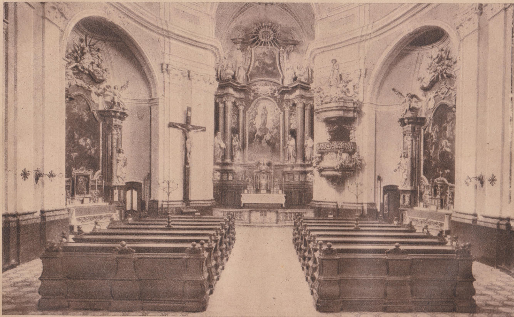
KÁRMELITA TEMPLOM BELSEJE