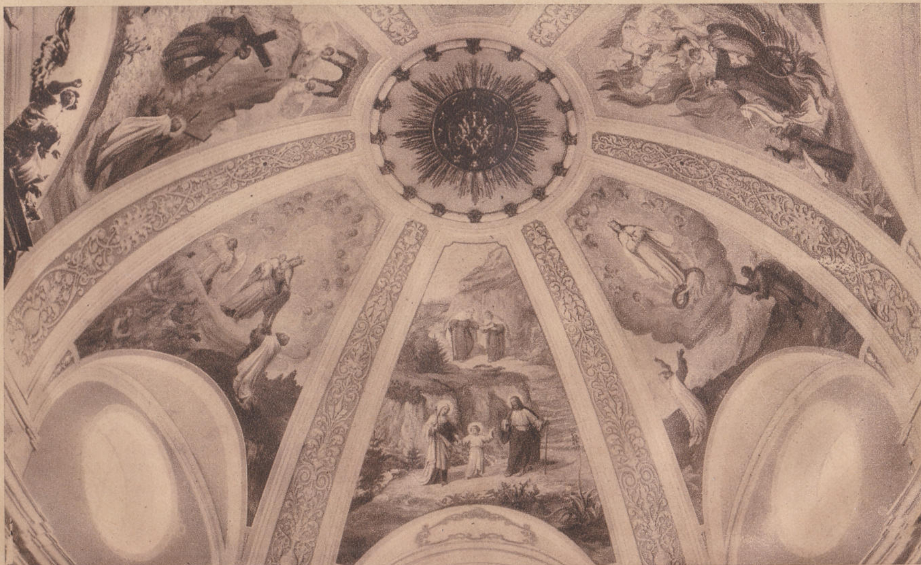
KÁRMELITA TEMPLOM FRESKÓI