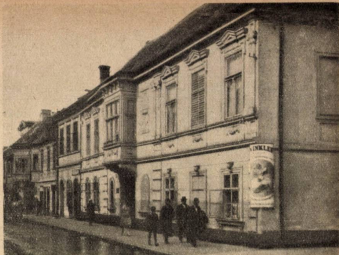
Megyeház-utcai részletek Győrben.