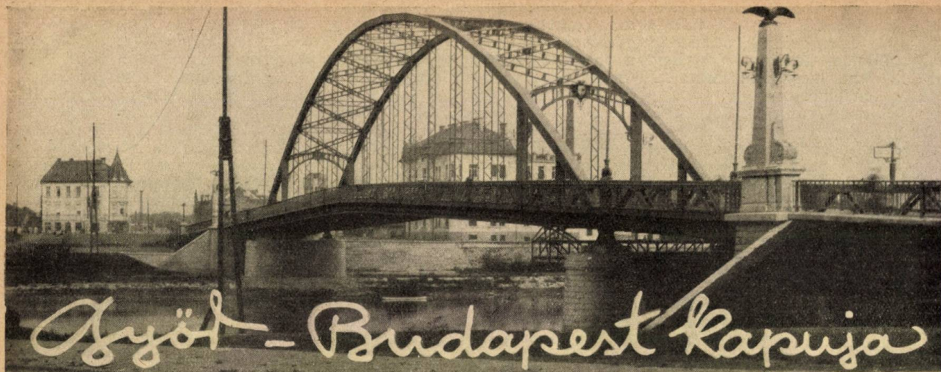
Az új Duna-híd, amely összeköti Révfalut Győrrel.

Ha valaki egyszer megírná a magyar városok galériáját, a legszebb és a leghálásabb írói feladatot végezné el. A magyar vidéknek annyi kincse és értéke van, hogy Budapest, a főváros, mindnyájunk elkapott és dédelgetett kedvence, nem is sejtí. A főváros, a maga szépségétől, nagyságától, gazdagságától elszédülve, alig vesz tudomást a vidéki empóriumokról, amelyek pedig gyakran szerves összefüggésben vannak Budapest életével, hiszen a vidéki városok, mint valami élő váröv veszik körül Magyarországot szívet, s amíg a kultúra fényét ettől kapják, maguk földrajzi, gazdasági és forgalmi elhelyezkedésükkel mintegy kapui a világvárosi arányokban szétterpeszkedő házrengetegnek. A többi vidéki város közül is kiemelkedik fekvésével, kulturális és történelmi múltjával, nagy iparával és vasuti gőcpontjával Győr, Budapestnek nyugat felől a legfontosabb kapuja, ahol, mikor lihegve megáll a nemzetközi vonatok mozdonya, a nyugati világvárosok és nagy birodalmak üzenetét lihegi a várakozó főváros felé.