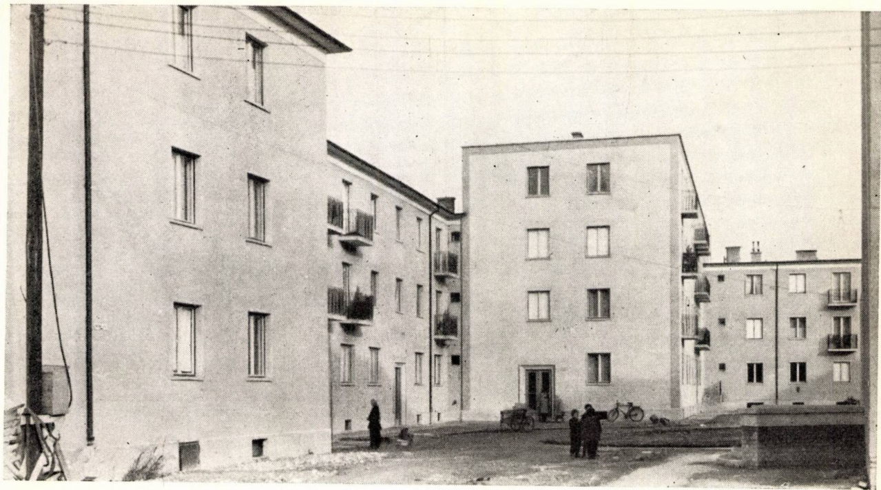
Győr, Kígyó utcai lakótelep, udvari homlokzat és alaprajz